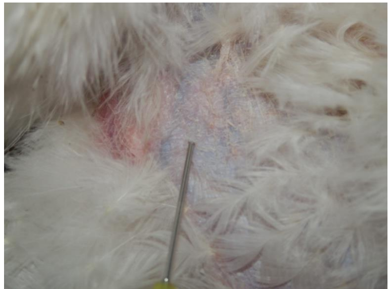
Mynd 1 Teikning til vinstri og ljósmynd af sama svæði til hægri