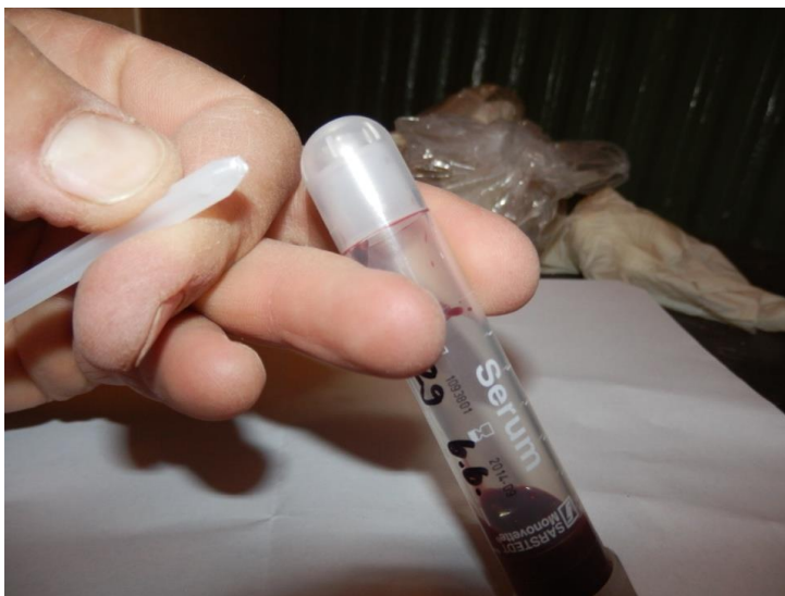
Mynd 3 Stimpill brotinn af