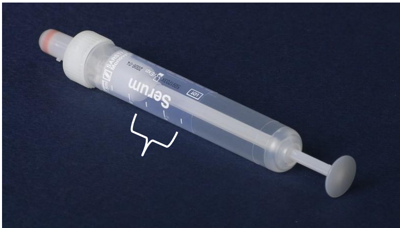
Mynd 2 Magn blóðs (2 ml) merkt á 9 ml blóðsýnasprautu